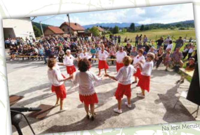
Na lepi Menišiji