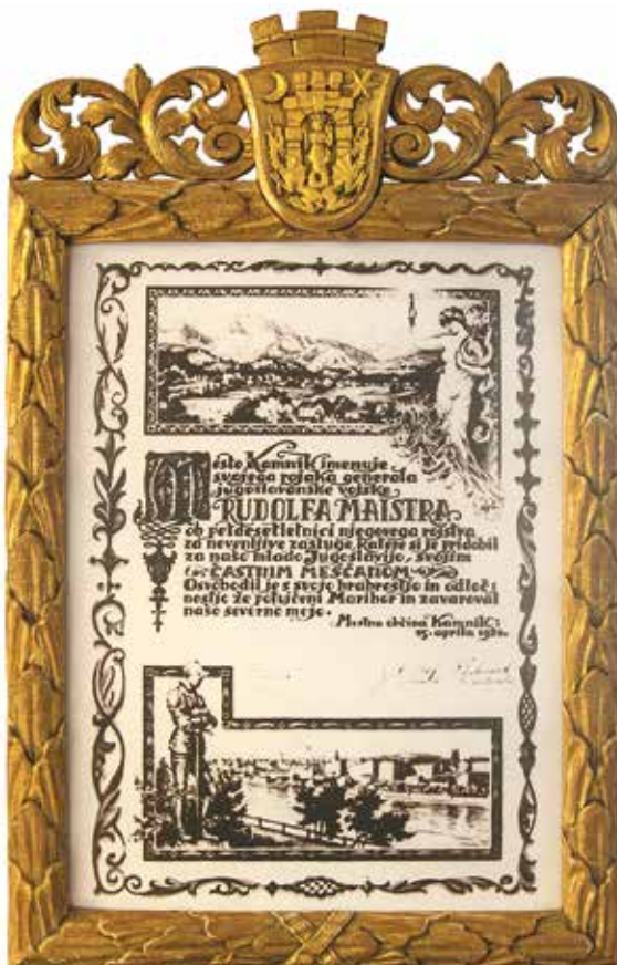
Diploma častnega meščana

Tako Maister kot Gaspari bi si zaslužila obsežnejšo obravnavo v osnovnih šolah, saj sta oba vzoren zgled za domoljubje. Slava obema.