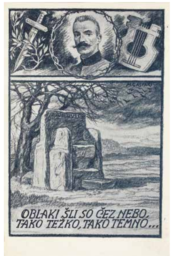
Rudolf Maister kot ga je na razglednici upodobil Maksim Gaspari.