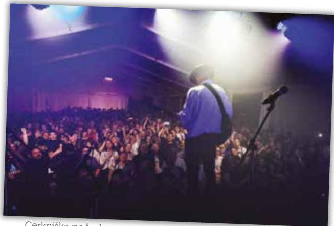
Cerkniška noč s koncertom Vlada Kreslina in Ansambлом Potepini

V program ob občinskem prazniku se je letos vpisalo več kot 70 športnih, zabavnih, družabnih, izobraževalnih, otroških dogodkov in prireditev, ki so jih pripravili društva, zavodi in institucije iz občine Cerknica. Kot pričajo fotografije, se je v občini Cerknica res dogajalo veliko zanimivega.