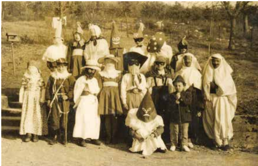
Šeme, pustni torek na jezerski šoli, 1. marec 1960, hrani Lojzka Stražišar.

k Svetemu Vidu. Kaplan je šel kar v šolo vprašat, kdaj bo konec pouka. Učiteljica mu je povedala, potem je šel doli v cerkev, mi smo prišli za njim. V Starem trgu smo prejeli svete zakramente.