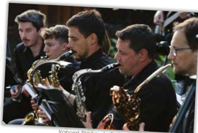
Koncert Big banda Cerknica na vrtu Galerije Krpan