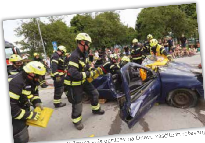
Prikazna vaja gasilcev na Dnevu zaščite in reševanja