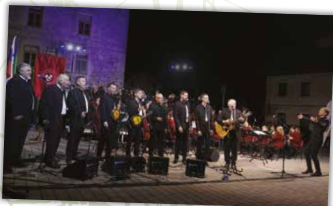
Poletni večer Godbe Cerknica z gosti – Klapo Galeb