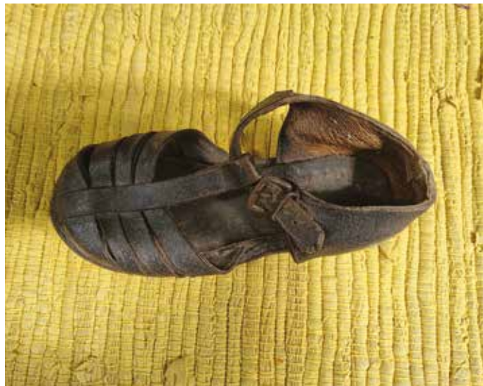
Usnjena sandalica, na podplatu ima spredaj in zadaj pritrjeni šinci, hrani Lojzka Stražišar.