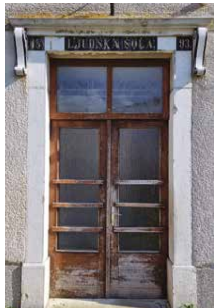
Portal stare grahovske šole z letnico 1893 (MH)