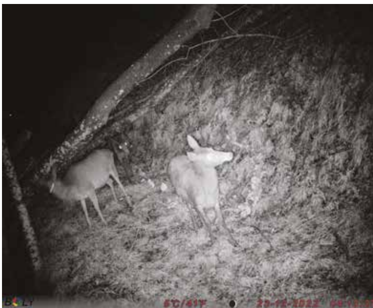
Nočno življenje mejic. Brez ustreznih zaščit nasajenih dreves in grmov bi divjad uničila večji del nasajenih sadik.