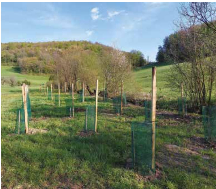
Dopolnjena mejica, ki bo služila kot protivetрна zaščita, za povečanje medonosnosti in proizvodnjo gomoljčk (tartufov), na kmetiji Vertovšek.

Evropski kmetijski sklad za razvoj podeželja: Evropa investira v podeželje