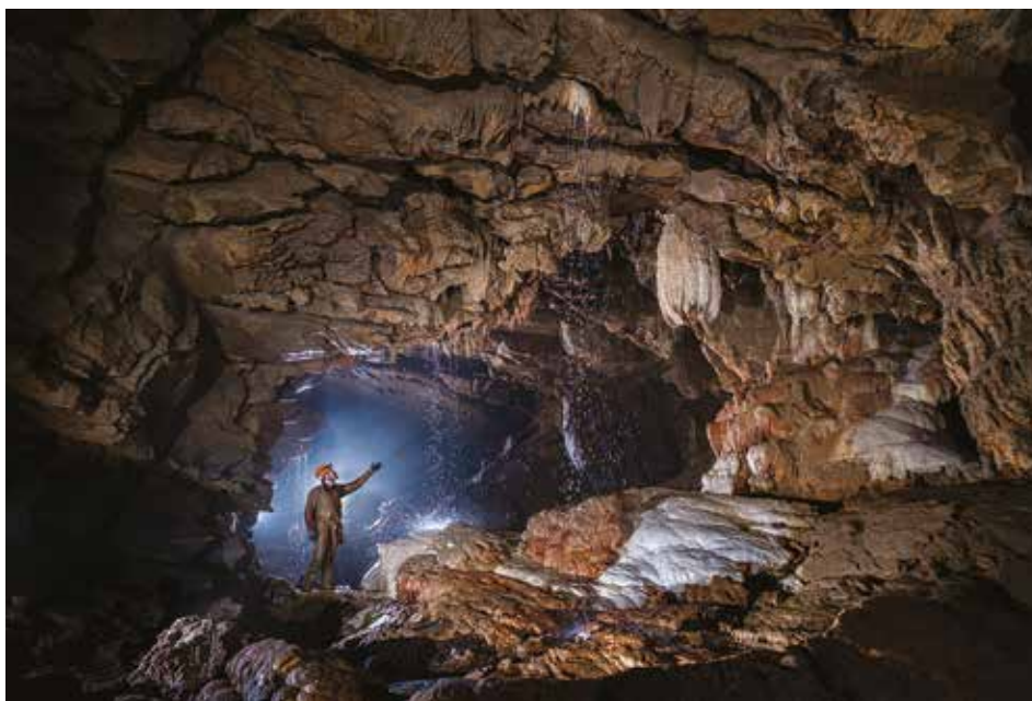
Rov v Vranjedolski jami

Jama je zelo razvejana in veliko rovonov je še nepregledanih. Med zadnjim raziskovanjem smo vztrajali po rovu, ki gre najbolj južno v masiv Javornika. Na koncu se odpre nova dolga dvorana z balvani; daleč naprej pa črnina za prihodnja raziskovanja. Trenutno izmerjenih je 1694 m dolžine, globina jame je 111 m.