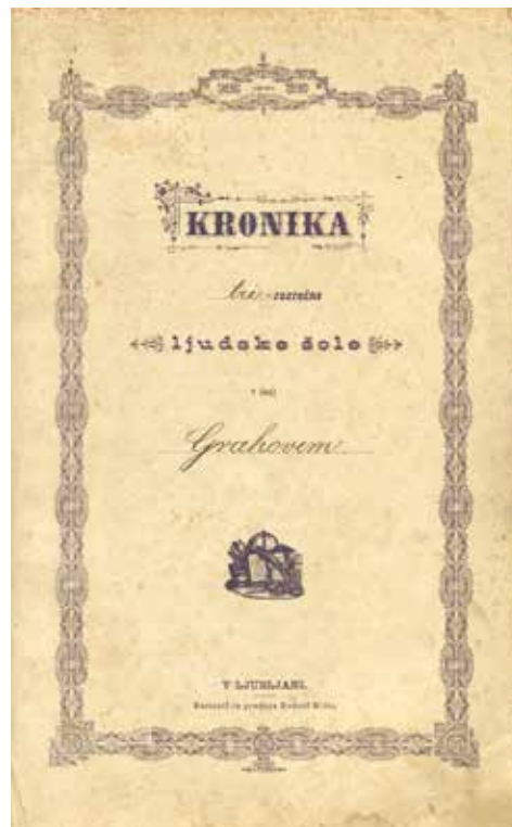
Šolska kronika od 1893 naprej, hrani ZAL