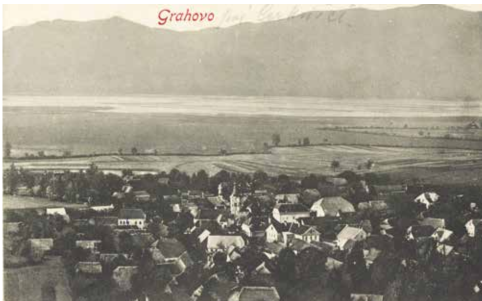
Na razglednici iz leta 1908 je na sredini lepo vidno šolsko poslopje.