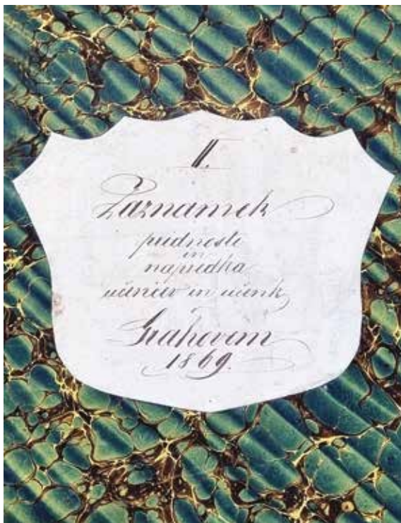
Zaznamek pridnosti, 1869, hrani Zgodovinski arhiv Ljubljana (ZAL).