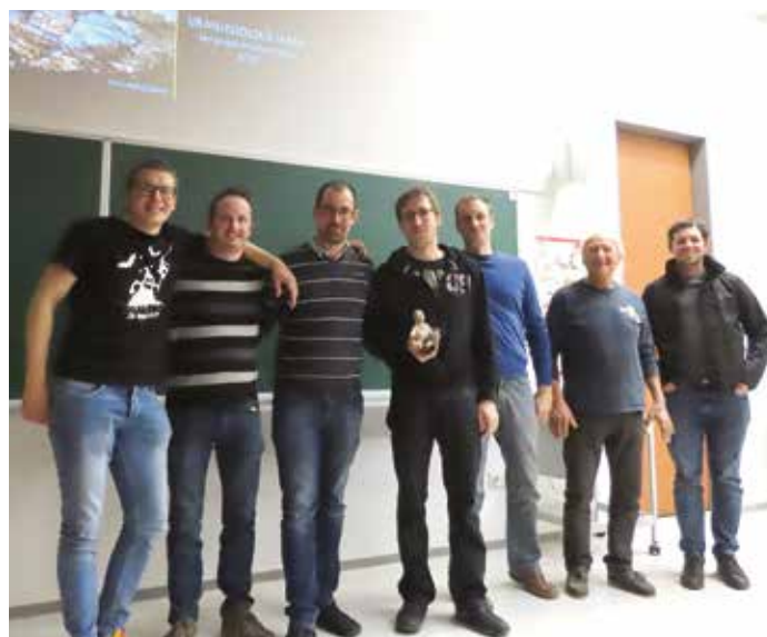
Ekipa prvonagrajencev