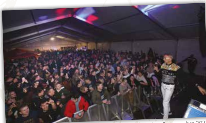
Veseli december v Cerknici, 1. in 2. december 2023