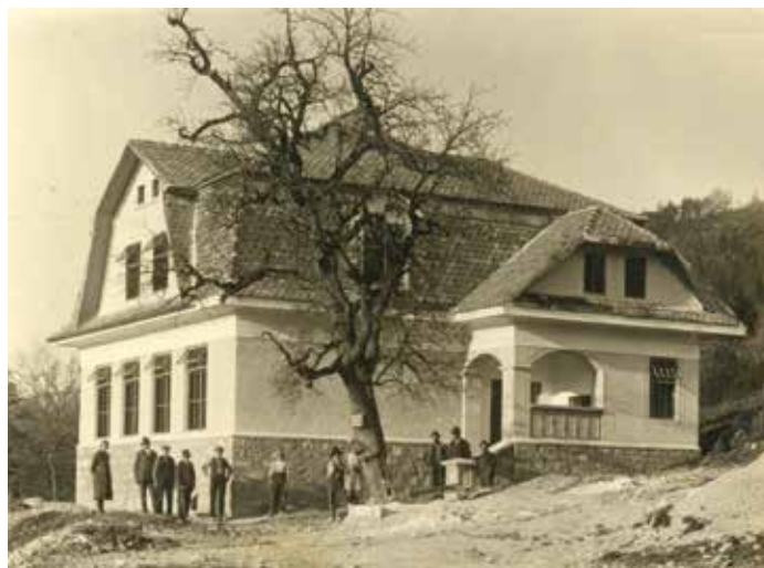
Sl. 2: Osnovna šola Gorenje Jezero okrog leta 1928 še brez napisa na pročelju, hrani Knjižnica Jožeta Udoviča Cerknica (KJUC).