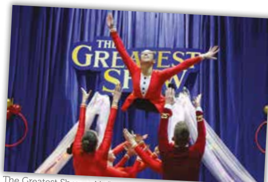
The Greatest Show z Mažoretnim, twirling in plesnim klubom Mace Cerknica, 9. december 2023