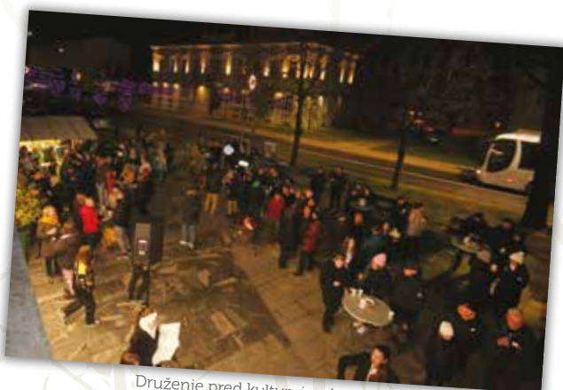
Druženje pred kulturnim domom, 27. december 2023