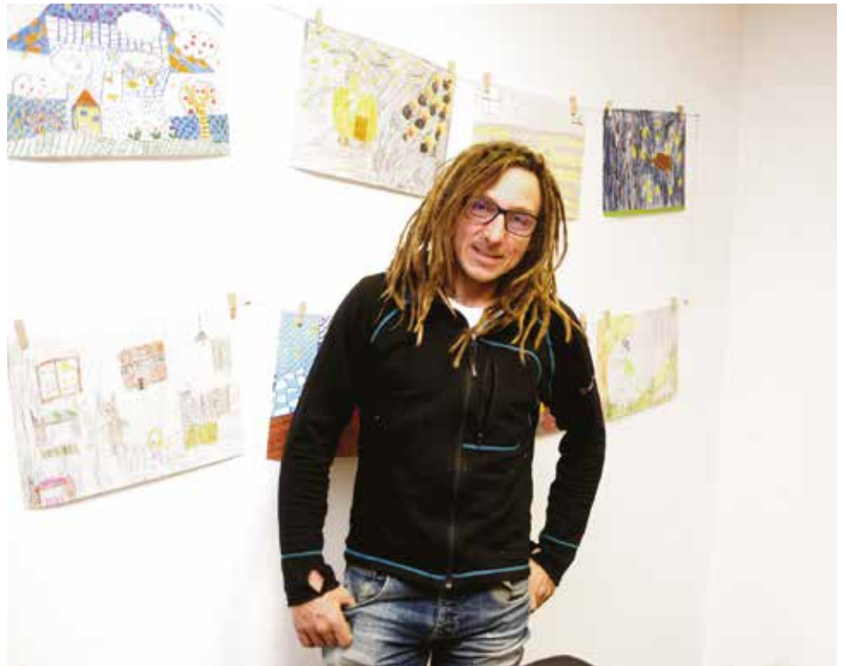
S kolegi išče tudi nižje ležeče vhode. »Da bomo lažje naredili sistem.«

Mogoče bi bil alpinist, če ne bi bili na Rakeku. Kaj pa vem. Človek je nekje lociran. Na Rakeku sem igral nogomet, pingpong, malo sem bil pri gasilcih ... Domov sem za podpisat prinesel listek za jamarje, čez en teden pa še za gasilce. Oče mi je rekel: »Ne moreš biti dober jamar in dober gasilec. Odločiti se moraš.« Takrat sem se odločil za jamarstvo in to počnem. Nimam pa se za jamarja, to je košček mojega življenja. Hodim v jame, nekaj pač moraš početi. V dolge in globoke jame pa hodim, ker se drugih hitro naveličam. 40-, 50-metrске jame, ki so tu naokoli, so vse podobne, daljše pa so vodoravne; mene privlačijo brezna in ne preveč kiča.