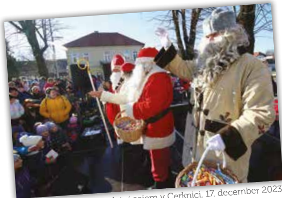
Božično-novoletni sejem v Cerknici, 17. december 2023