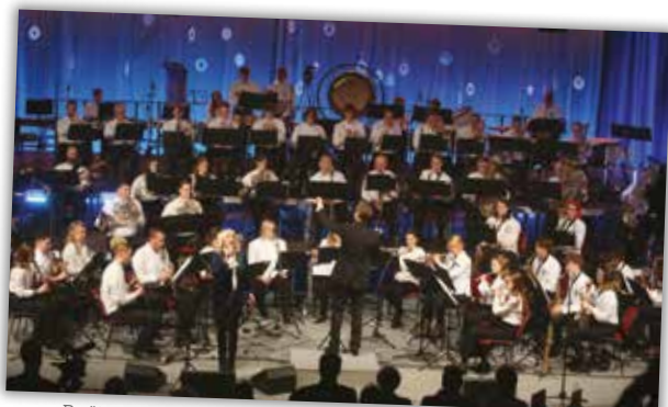
Božično-novoletni koncert Godbe Cerknica, 25. december 2023