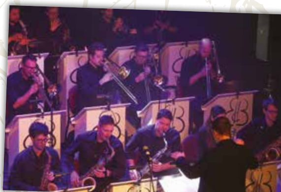
Koncert BBC ob 20-letnici delovanja, 27. december 2023