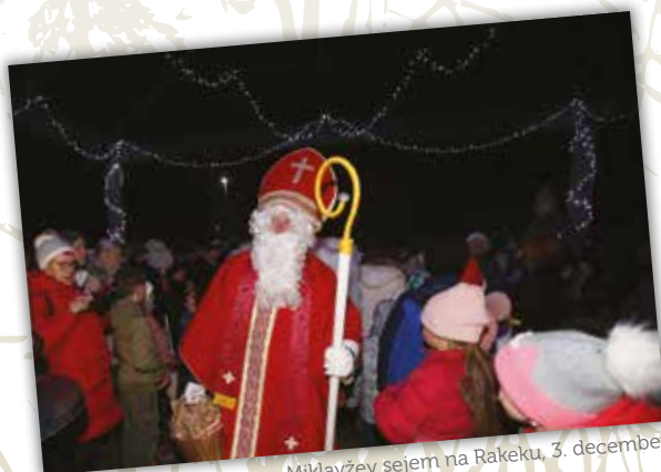
Miklavžev sejem na Rakeku, 3. december