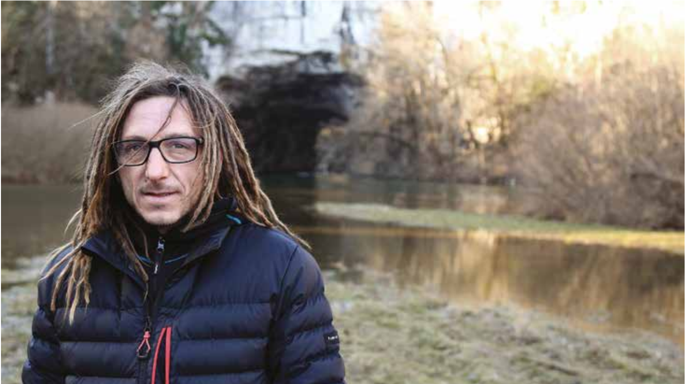
Pred »imenitnim jamskim sistemom«, Velikim naravnim mostom.

Vrtiglavico, Čehi 2 in jamo Ghost riders. To je hudo! Jaz, normalno, z leti ugašam in to raziskovanje je treba predati naprej. Jamarstvo se še ni nehalo razvijati. Tudi jaz sem še začel s karbidovko, ampak zdaj lahko luč prižgemo! Zato sem marsikaj našel, česar tisti, ki so šli v jame pred mano, niso mogli. Tehnika je drugačna, oprema je boljša. Skratka, rad bi našel ljudi, ki imajo podobne ideje. Nekaj sem jih že. Je pa to kar težavno. Imamo društva in vsak nekaj zase vrtička.