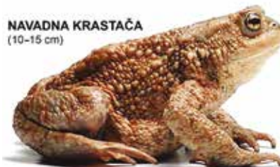
NAVADNA KRSTAČA (10–15 cm)