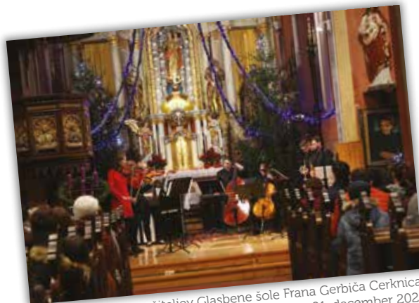
Koncert učiteljev Glasbene šole Frana Gerbiča Cerknica, 21. december 2023