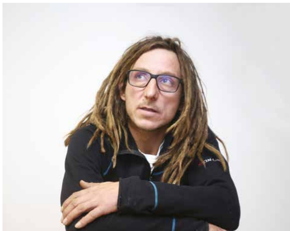
»Lepo, da se pogovarjamo o jamarstvu, tudi ko ni ali nesreče ali rekorda.«

Največji rizik je priti do jame z avtom. Če boš prišel srečno, je odvisno še od tretjih,