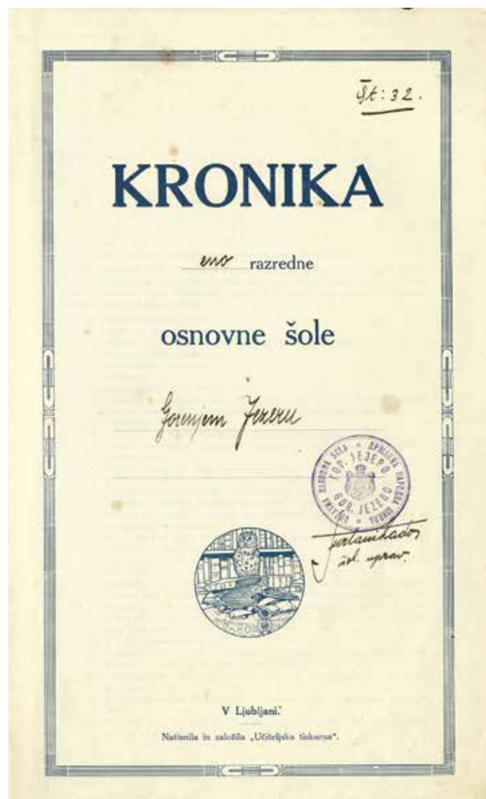
Sl. 4: Kronika osnovne šole Gorenje Jezero od šolskega leta 1935/36 do 1963, hrani Zgodovinski arhiv Ljubljana (© ZAL).

Verouk je v šolskem letu 1935/36 poučeval starotrški župnik Jernej Hafner , od 1. aprila 1937 starotrški kaplan Josip Lušin , v šolskem letu 1942/43 pa župnik Pavel Podbregar . Dne 19. julija 1943 je šolska mladina pred šolskim poslopjem pozdravila škofa Gregorija Rožmana .