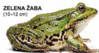
ZELENA ŽABA (10–12 cm)