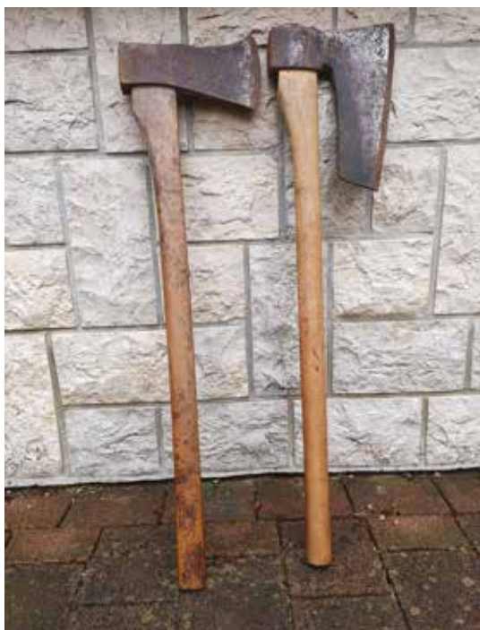
Sekira in plankača