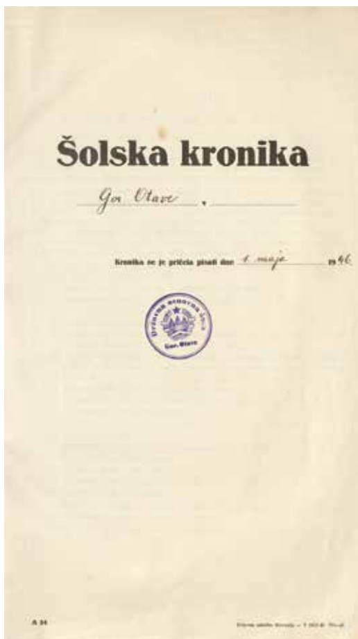
Naslovna stran kronike