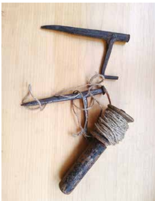
Kobilica z navitjem vrvice