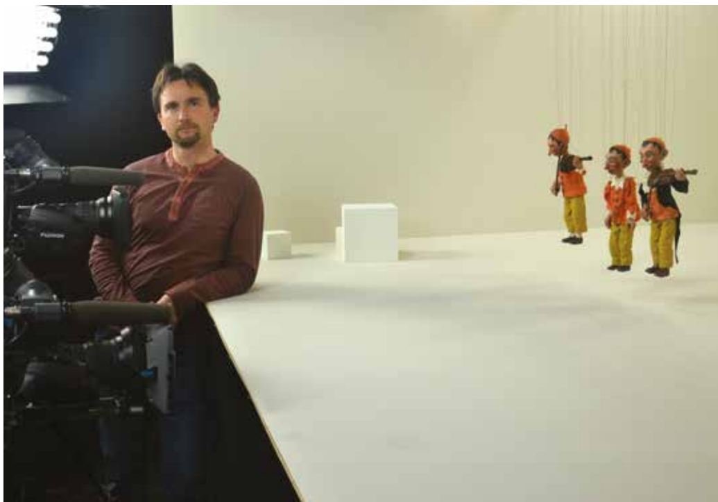
Vsak službeni dan prinaša nova znanja in nove možnosti izražanje s kamero.

V Veselem toboganu z Rakeka pojem v pevskem zboru. Kakšen projekt je to bil! Posnetki so še kvalitetni. Vse, kar je posneto na film, obdrži kvaliteto, posnetki, narejeni z začetka