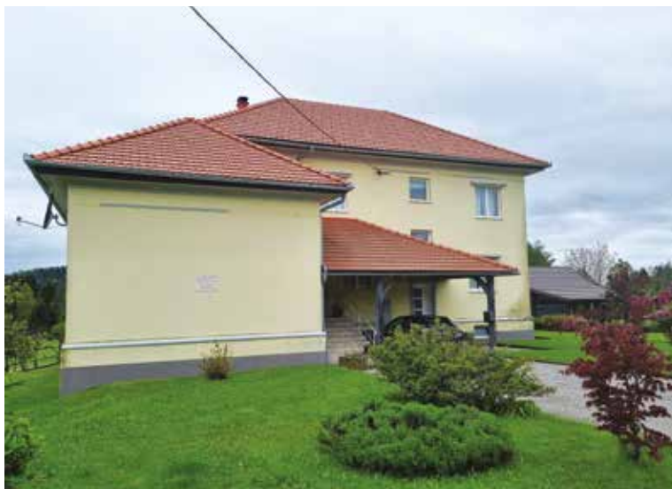
Današnji pogled na nekdanjo otavsko šolo