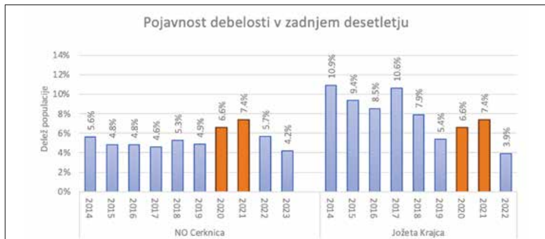
Grafični prikaz 1: Delež šolarjev, ki imajo tako visoke vrednosti maščobne mase, da je njihovo stanje ocenjeno kot debelost. Grafi so prikazani ločeno po matičnih šolah občine Cerknica (SLOfit).

smernice so za povečanje števila ur športa, za dobro delo pa se potrebuje dovolj prostora, košev in ostalih športnih pripomočkov ...« Aktiv športnih pedagogov OŠ Rakek dodaja: »Na občinski ravni bi bilo po našem mnenju treba obnoviti zunanja igrišča, predvsem igrišče na Uncu, in otroke še bolj vzpodbujati k vključevanju v izvenšolske dejavnosti.«