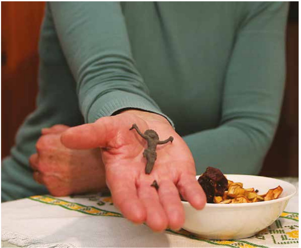
Tihožitje: izvezen prt, domači krhlji in križec, ki bo kmalu spet varoval domačijo.

Kot sodnica gasilsko-športnih tekmovalnih disciplin otroke spremljam od njihovega šestega leta dalje in hitro vidim, kako gre čas naprej! Verouk učim peti in šesti razred. Ti otroci odraščajo in navaditi jih je treba, da si svobodni, če si pošteni, skozi odlomke iz Svetega pisma in prilik iz vsakdanjega življenja. Moraš delati na tem, da boš odraščal tako, da boš šel po pravi poti oziroma če skreneš z nje, da boš imel toliko moči, da boš prišel nazaj. Tega ne raziskujem, a vem, da so danes otroci zaradi