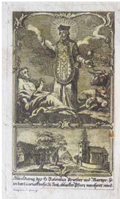
Sl. 2: Sveti Valentin, hrani SKL (© SKL).

Križna gora je že od nekdaj znana po šestih romarskih shodih: na tiho nedeljo, na peto nedeljo po veliki noči, na binkošti, na nedeljo po godu sv. Ane, na nedeljo po povišanju sv. Križa, na nedeljo po godu sv. Luka. Leta 1743 so bile postavljene kapelice in blagoslovljene slike križevega pota. V Romarskih bukvicah iz 18. stoletja, ki jih je napisal J. F. Repež, hrani jih tudi cerkniška knjižnica, je zapisal: »Romar lubi, bolnik tudi, pridi sem pod sveti Križ, te zagvišam, da boš vslšan, prosi vse, karkul želiš.« Podobica sv. Križa je bila objavljena tudi v knjižici z naslovom Pot svetiga križa avtorja Leonarda da Porto Maurizia, hrani jo cerkniška knjižnica, izšla