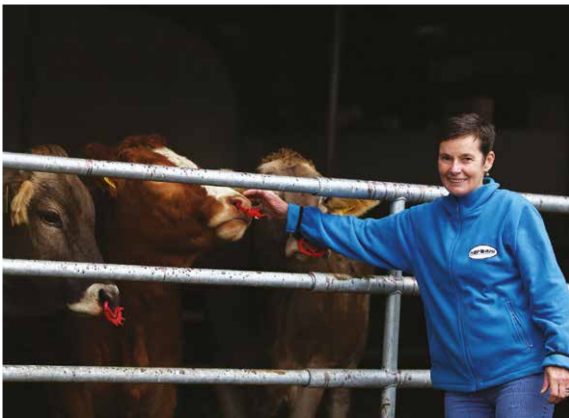
Dela na kmetiji je vajena že od doma.

bila s tam. 48. leta so jo umaknili, še na eni sliki jo imamo. Ko smo okoli leta 2012 začeli rekonstrukcijo hiše, smo za kotlovnico odkopali krvino in našli del kolone. Zdaj iščemo prostor zanjo. Iz istega kamna je kot stebri. Po stotih letih sem dobila nazaj družinsko narodno nošo. Navada je bila, da gre z najstarejšo hčerko iz hiše za doto. Sliko smo imeli, ko je bila v njej moževa stara mama. Nazaj jo je podarila moževa sestrična. Ko jo je prinesla in rekla: »Glej, zdaj bo pa to tvoja.« Bila sem zelo ponosna, da mi je zaupala to družinsko dragocenost. Oblečem jo za posebne priložnosti. Z možem nama stare stvari ogromno pomenijo. Ko smo delali novo štalo, se je del starega cimpra malo podrl. Sin je slučajno v narezanem stebru opazil vdelan kovinski križec, morda star 200 let. Tudi rodovnikov smo se lotili. Okoli 1750 so Milavci iz Jakovice prišli