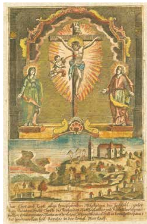
Sl. 5: Podobica s Križne gore, jedkanica, mere 256 x 167 mm, hrani GK NMS.