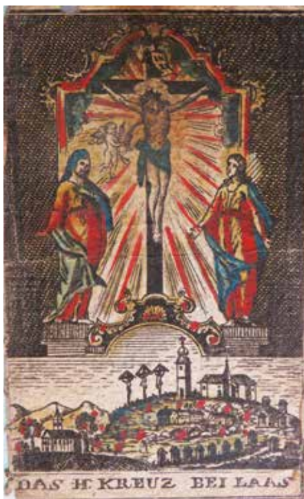
Sl. 4: Podobica s Križne gore, hrani SKL.