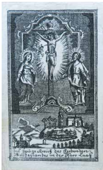
Sl. 3: Podobica s Križne gore, hrani NML (© SKL).