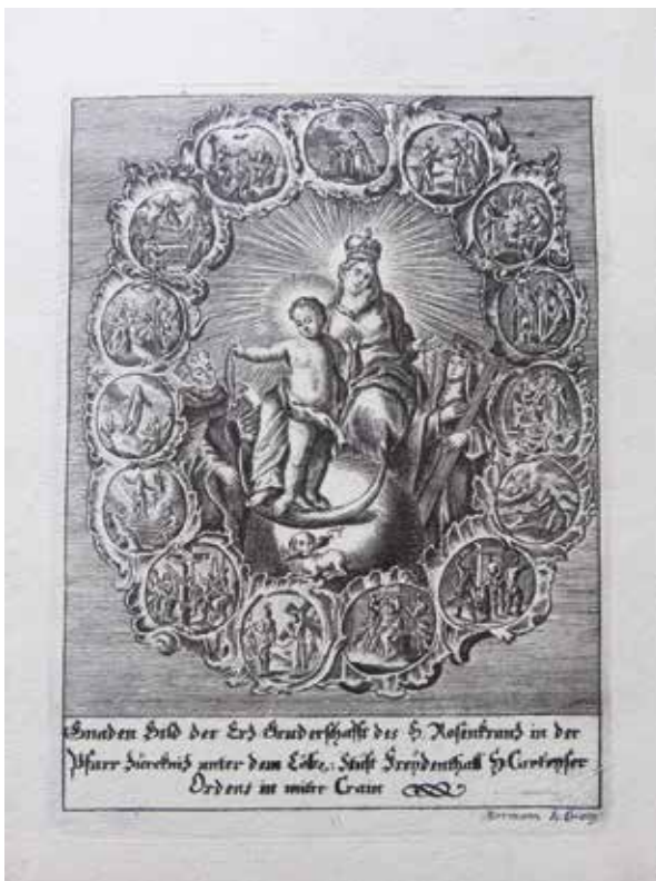
Sl. 1: Rožnovenska Mati božja, hrani SKL (© SKL).

da je v bratovščino vpisanih čez 86.000 oseb, od katerih jih je že 40.000 umrlo.«