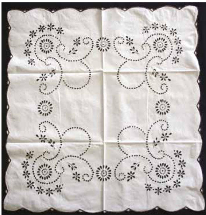
Slika 4: Prtič z merami 70 x 75 cm, hrani Majda Šušteršič.