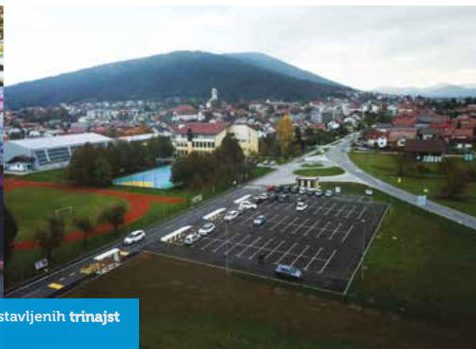
Občina Cerklje sodeluje v Evropskem tednu mobilnosti.

Postavljenih je bilo 28 avtobusnih postajališč . Skupno je bilo postavljenih trinajst prikazovalnikov hitrosti .