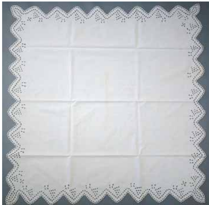
Slika 11: Prtič z merami 83 x 83 cm, hrani KJUC.

Prtiček za mizico (sl. 11) iz bombažnega platna prinaša enako vezeninsko motiviko kot preostali deli garniture,