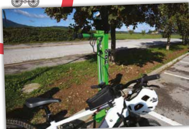
Prva polnilnica za električna kolesa v občini Cerknica