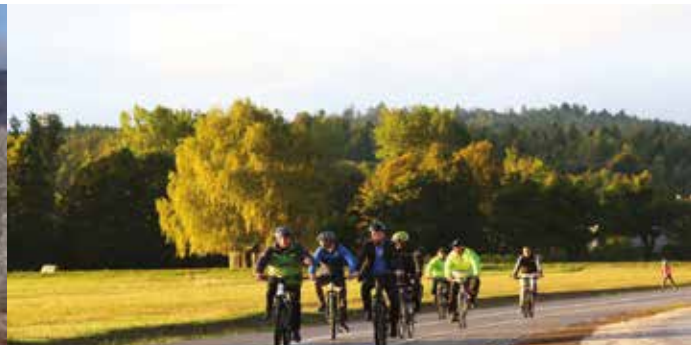
Kolesarska steza Cerknica–Dolenje Jezero