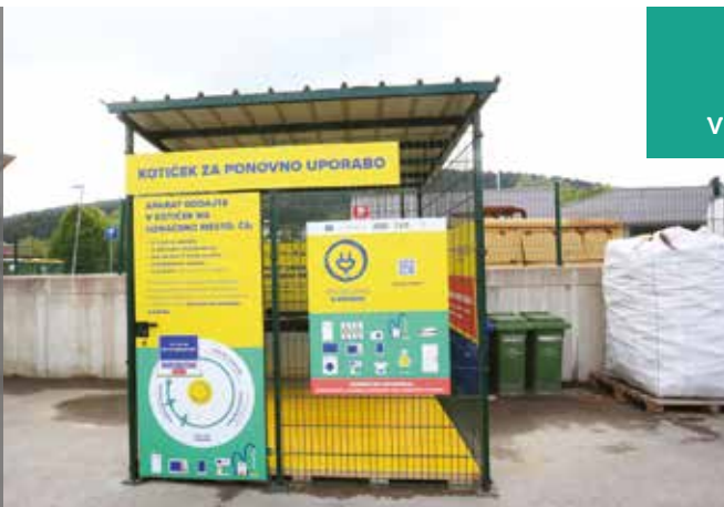
Kotiček za ponovno uporabo v Cerknici

Od 2011 je bilo zgrajenih 22,397 km kanalizacijskega omrežja . Za naložbe v odvajanje in čiščenje odpadne komunalne vode je Občina Cerknica od leta 2011 namenila skoraj 16 milijonov evrov . V občini Cerknica je skupno 58 ekoloških otokov , od tega 6 vkpanih.