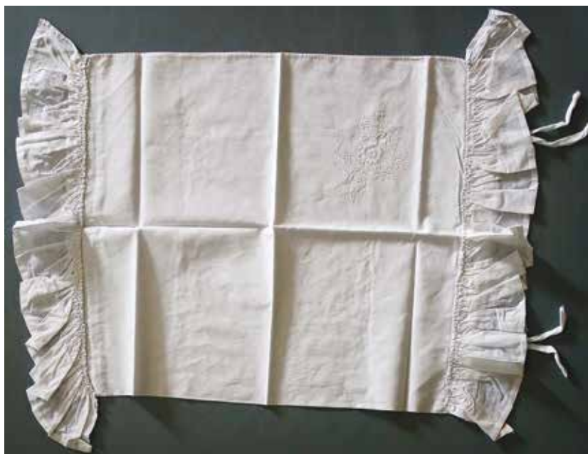
Slika 2: Prevleka za vzglavnik za na pare z merami 45 x 50 cm in na vsaki strani 9 cm naborek, hrani Majda Šušteršič.

Tudi prtiča prinašata vezenino, sestavljeno iz luknjic, vzorca obeh prtičev sta si podobna, prvi je izvezen in obzankan s črno nitjo, drugi, ki prinaša osem stiliziranih šopkov in cvetic, z belo.