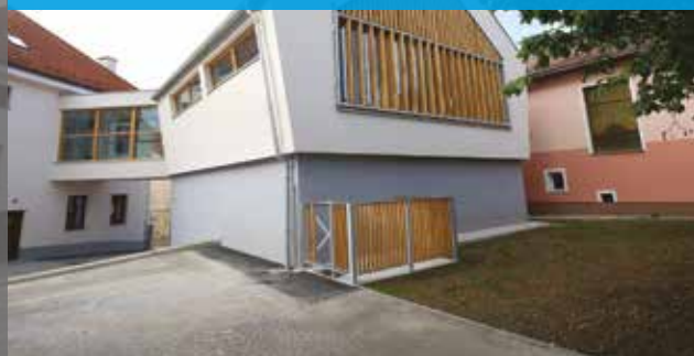
Prizidek Knjižnici Jožeta Udoviča Cerknica