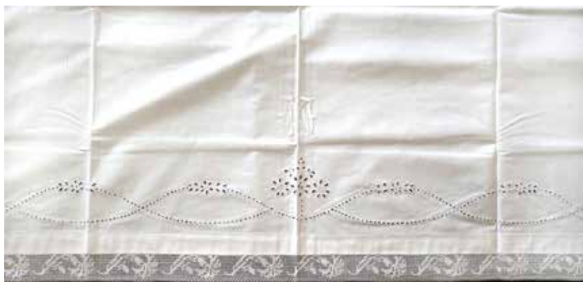
Slika 3: Mrliška rjuha oziroma pregrinjalo z merami 75 x 232 cm, detajl, hrani Majda Šušteršič.