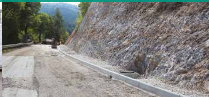
Gradnja kanalizacije Selšček in Begunje pri Cerknici

Od 2011 je bilo zgrajenih 22,397 km kanalizacijskega omrežja . Za naložbe v odvajanje in čiščenje odpadne komunalne vode je Občina Cerknica od leta 2011 namenila skoraj 16 milijonov evrov . V občini Cerknica je skupno 58 ekoloških otokov , od tega 6 vkpanih.