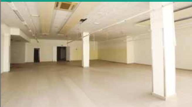
Prostori nekdanje trgovine Hura bodo namenjeni mladinskim organizacijam.

V mladinske organizacije je v občini Cerknica vključenih več kot 500 mladih .