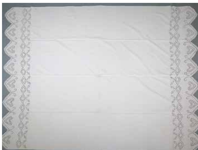
Slika 8: Mrliška rjuha z merami 160 x 210 cm, hrani KJUC.

zobci, ki imajo v vmesnem prostoru vezeno po eno srce ter stilizirano vejico, nad zobci je geometrijski vzorec z valovnico. V garnituri sta dve enaki mrliški rjuhi.