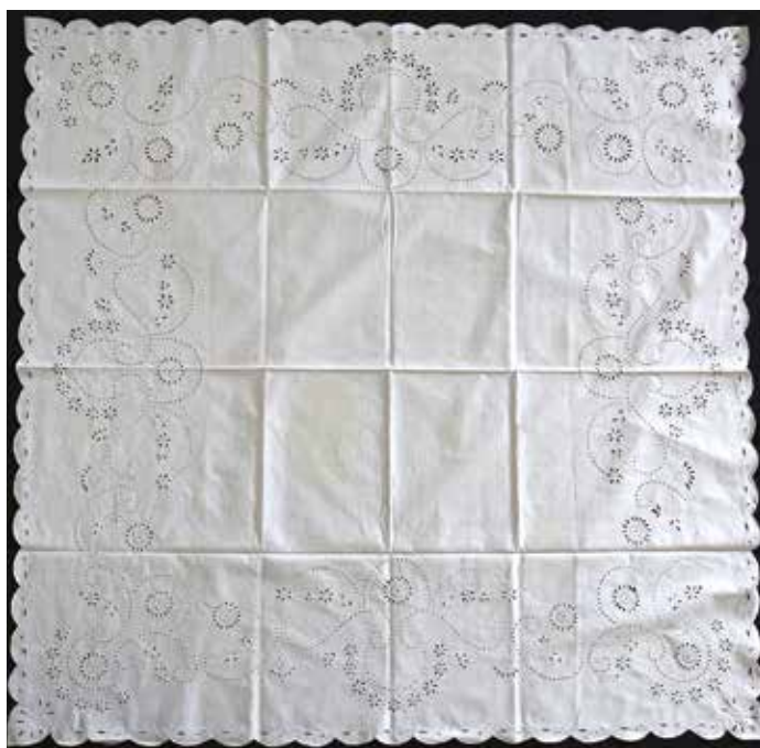
Slika 5: Prt z merami 133 x 135 cm, hrani Majda Šušteršič.