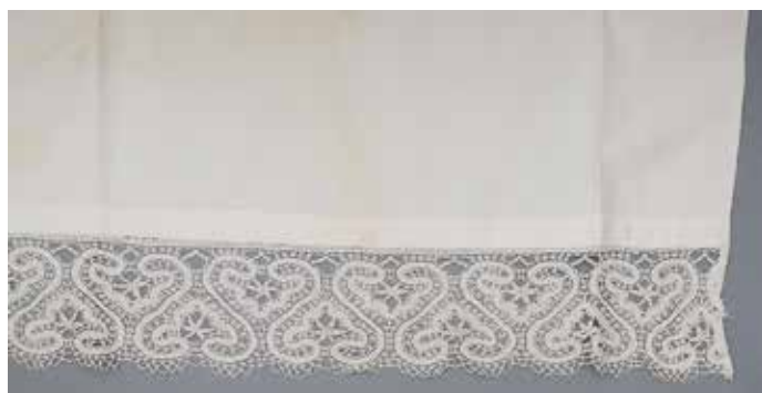
Slika 7: Mrliška rjuha, detajl z idrijsko čipko

zobci, ki imajo v vmesnem prostoru vezeno po eno srce ter stilizirano vejico, nad zobci je geometrijski vzorec z valovnico. V garnituri sta dve enaki mrliški rjuhi.