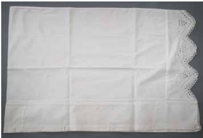
Slika 9: Preveleka za blazino z merami 47 x 70 cm, hrani KJUC.

tri okrasne bordure: spodnja, nad zobci v obliki ponavljajočih se cikcak linij, srednja v obliki ponavljajoče se valovnice s trolisti, zgornja s ponavljajočimi se do neprepoznavnosti stiliziranimi vejicami.«