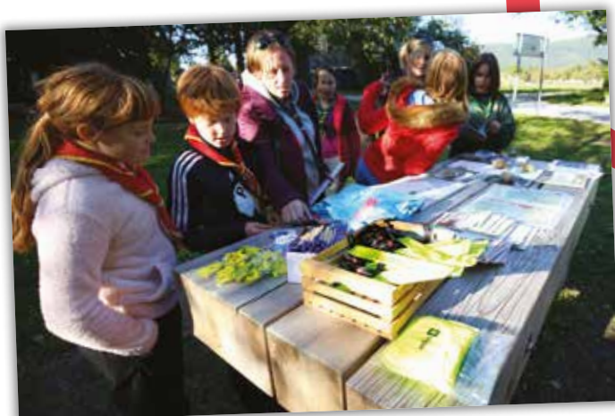
Mini sejem trajnostne mobilnosti