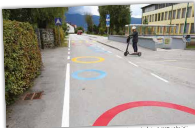
Talne označbe pri vrtcu in šoli voznike opozarjajo na izdatno previdnost.