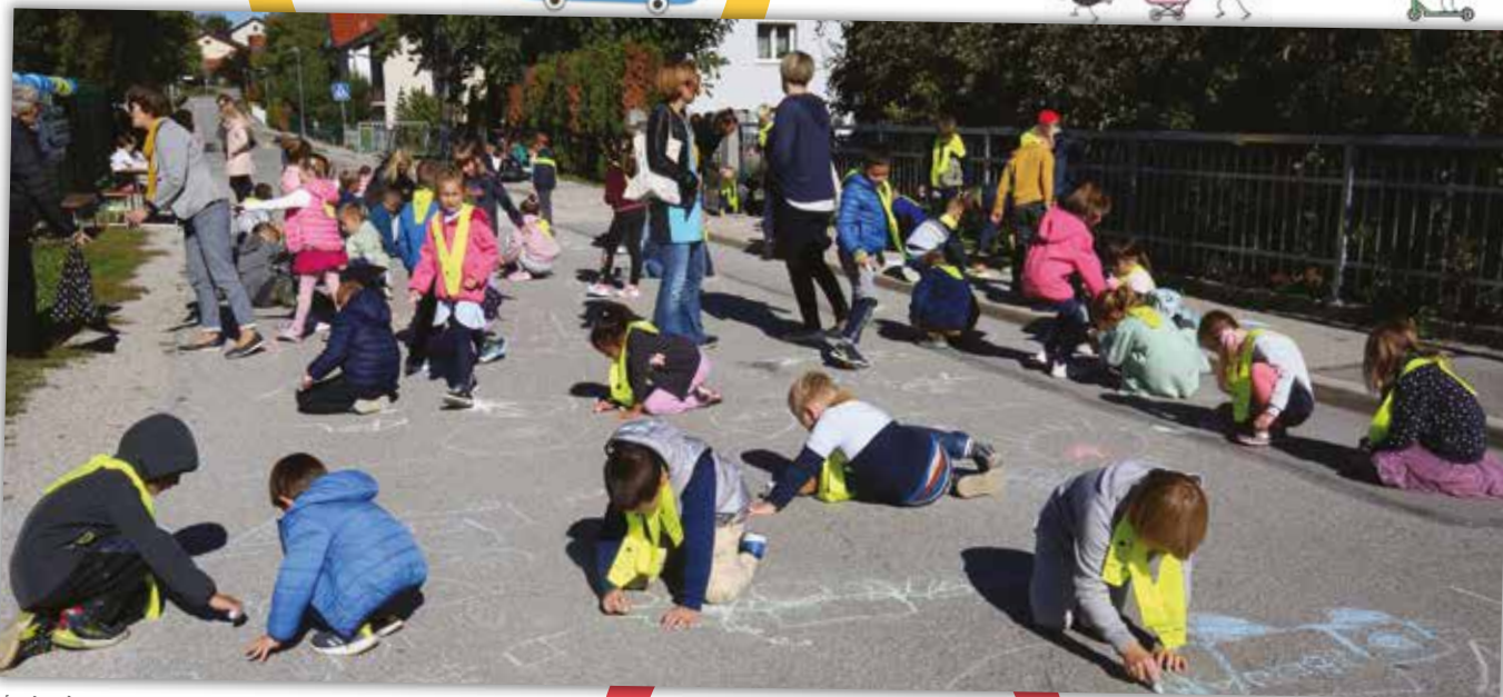
Na dan brez avtomobila je bil Videm igrišče, poligon in atelje.