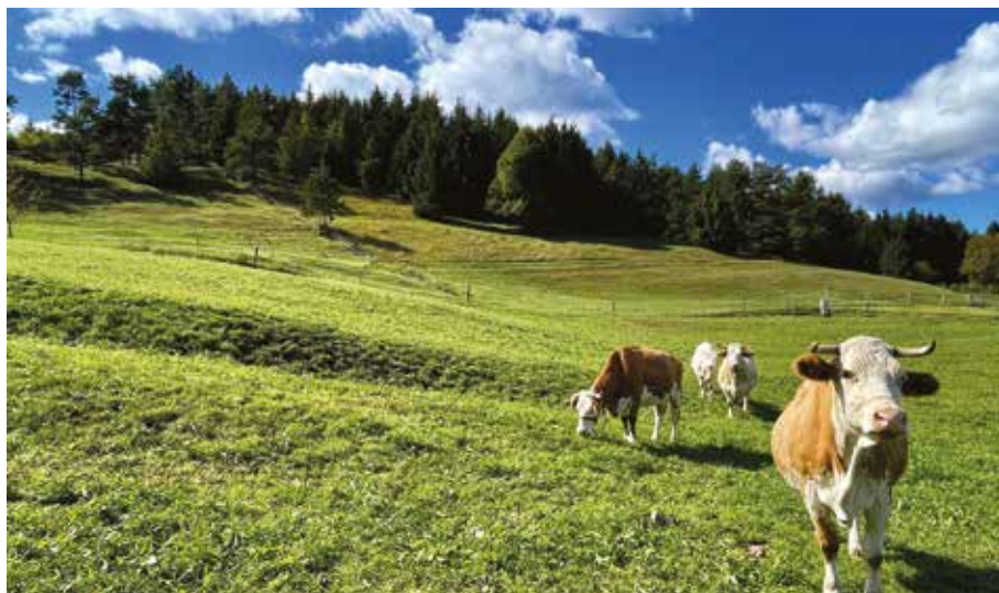
Na kmetiji Urbas imajo zaradi letošnjega sušnega obdobja 35 odstotkov manj krme.

pove, da jo nekateri sprašujejo, ali lahko prijavijo vrtnine – korenček ipd. »Če je bil spomladi na subvencijski vlogi prijavljen korenček, potem ja,« odgovori. Vendar to ni edini