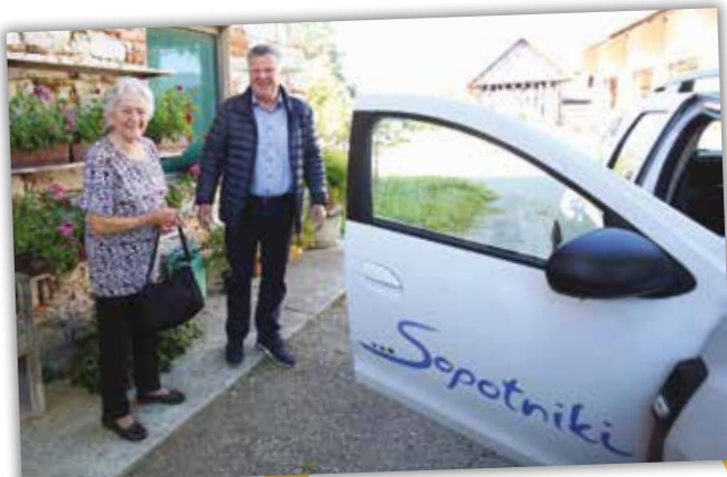
Župani za volani