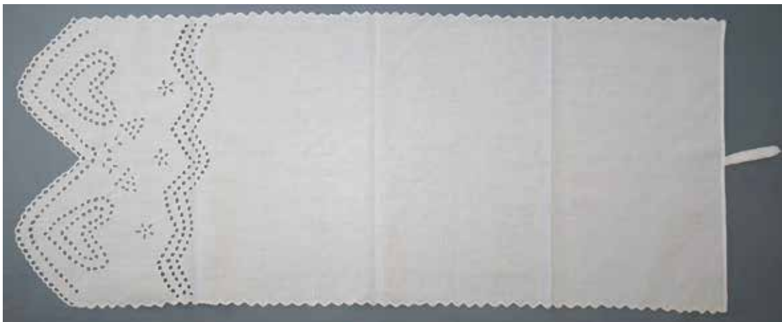
Slika 12: Brisača za previdenje z merami 39 x 93 cm, hrani KJUC.

da, nad tem je motiv rožic in valovnic. Stranska robova zaključujejo preprosti zobci. Pentlja za obešanje je prišita na sredini.