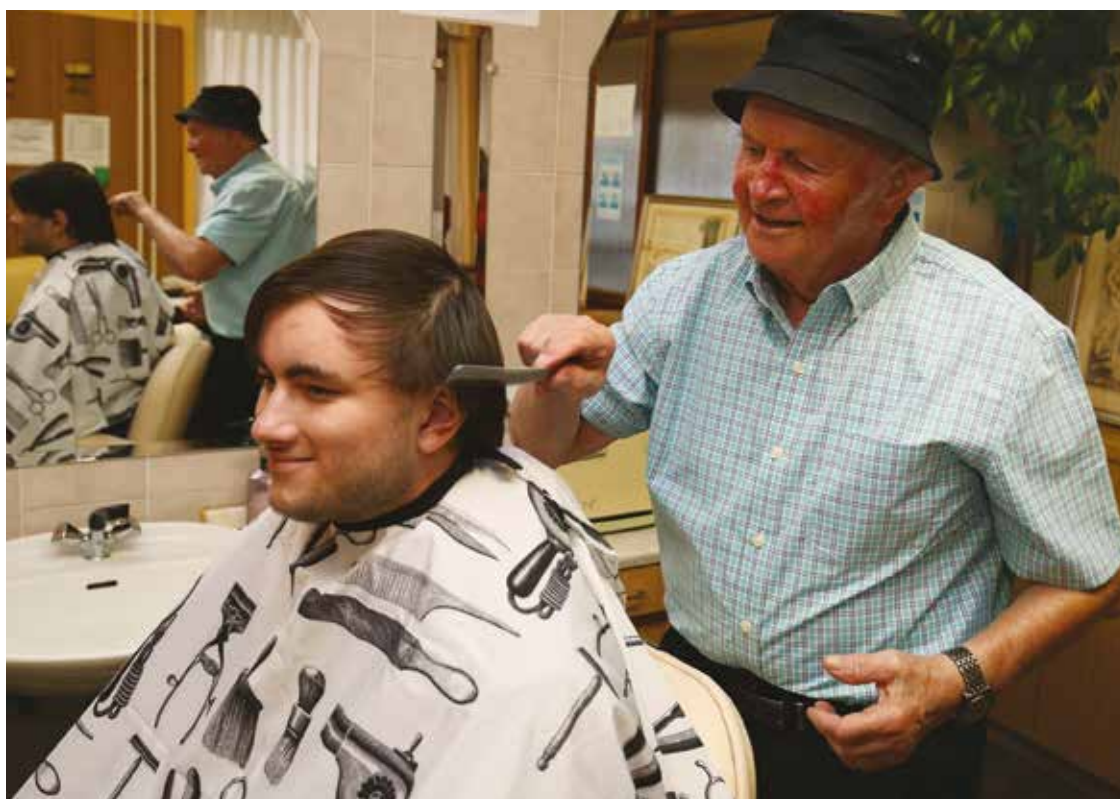
V svojem delu in med ljudmi, s katerimi se je srečeval, je užival.

Draga, pa še dobil je nisi. Ata je je nekaj prinesel s sabo, jaz sem kupoval v Ljubljani. Na Židovski ulici. Okoli 70. leta je bila tam drogerija, ki je imela