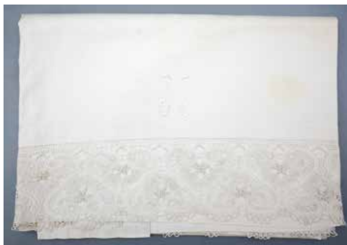
Slika 6: Mrliška rjuha z monogramom PN z merami 143 x 215 cm, hrani KJUC.

Mrliška rjuha oziroma prt (sl. 8) z bogato belo luknjičavo vezenino je narejena iz dveh kosov belega bombažnega platna, ki sta na sredini ročno sešita. Robova zaključujejo