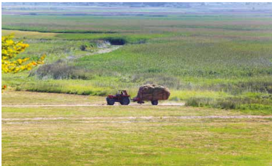
Poletje 2022 je bilo na ravni države izrazito nadpovprečno toplo in sončno ter zelo suho.

Opisane vremenske razmere so bile krive, da se je tudi kmetija Urbas iz Slivic pri Uncu letos poletni bojevala s sušo. Maruša Kranjec , inž. kmetijstva in krajine, mi pove: »Na kmetiji živimo tri generacije. Leži na nadmorski višini 505 metrov in ima prelep razgled na coprniško Slivnico.« Glavna kmetijska dejavnost kmetije Urbas je živinoreja. »Na kmetiji obdelujemo 17 hektarjev kmetijskih zemljišč, od tega 0,4 hektarja njiv in 7,6 hektarja travnikov in 9 hektarjev gozda. Redimo do 13 glav lisaste pasme goveda,« nadaljuje sogovornica. Vso krmo za osnovni obrok živali kmetija pridelata doma na svojih kmetijskih površinah, toda Maruša pove, da bo na kmetiji zaradi letošnjega sušnega obdobja 35 odstotkov manj krme. »Večje težave so nastale na boljših zemljiščih, kjer je bolje pognojeno in je moč pridelati dovolj kakovostne krme. Na teh travnikih je rast bujnejša, vendar je zaradi suše bila rast ovirana ter je zastala. Ker je bila rast ovirana in počasna, se trava nima moč razraščati in zato se v rastlinah povečuje koncentracija vlaknin, kar posledično znižuje hranilno vrednost. Taka krma pokriva le potrebe po vzdrževanju in omogoča živalim le in zgolj preživetje. S tako krmo žival ni sposobna ustvarjati