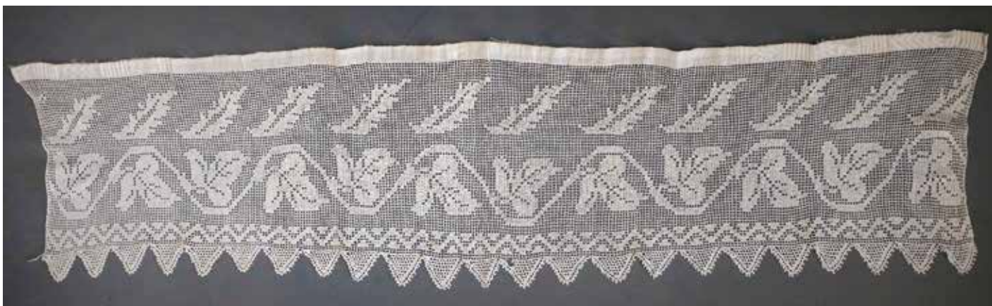
Slika 10: Zavesa z merami 35 x 150 cm, hrani KJUC.