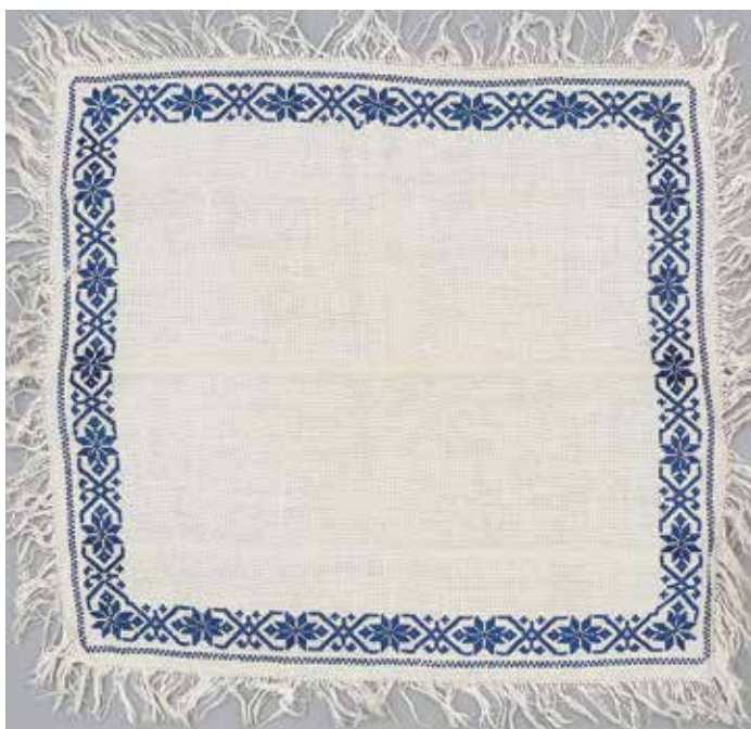
Belokranjsko tkaničenje. Prtiček z merami 34 x 37 s 3 cm resicami.