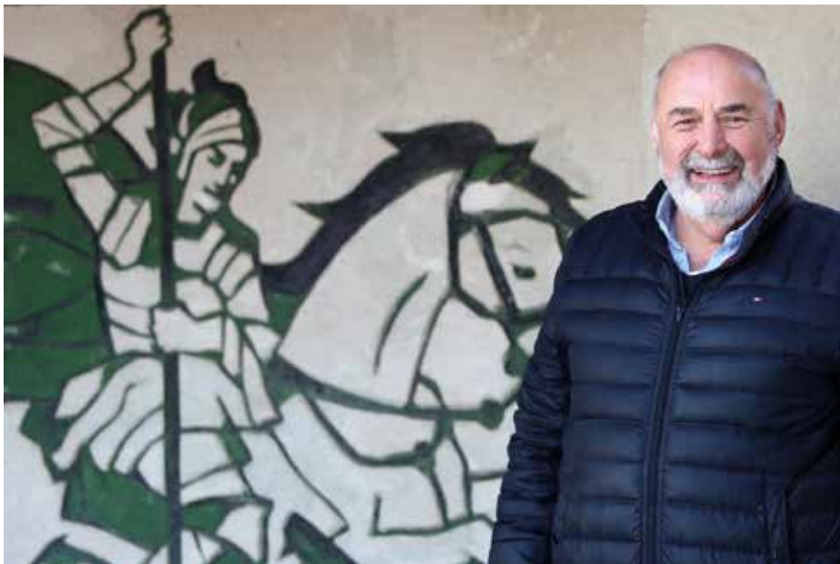
Obnavlja sosednjo domačijo s Perkovima praskankama, ki jo je nedavno kupil.