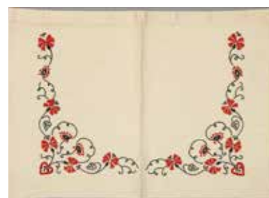
Prevleka za blazino, mere 36 x 52