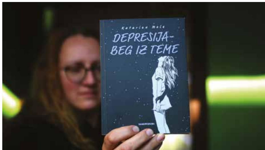
Knjiga Depresija – beg iz teme je nastala iz dnevniških zapiskov.