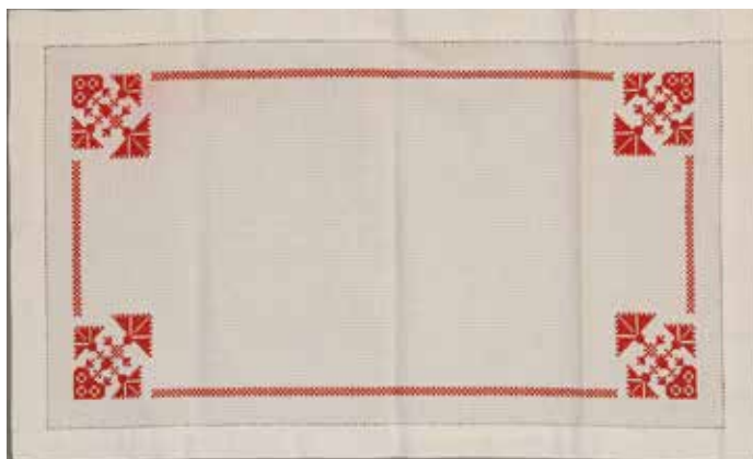
Prtič s križci z merami 35 x 57 cm