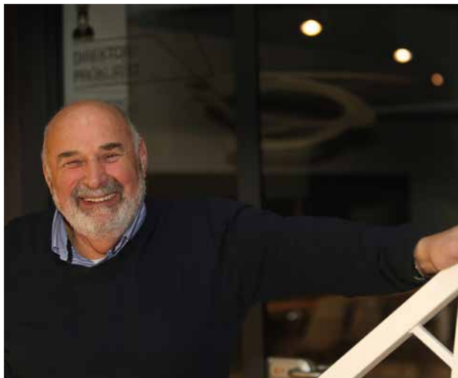
V podjetju se iskrijo oči.

Hitro sta začela dihati s firmo. Je pa res, da sta bila v njej dostikrat kot majhna fantička in mi pomagala. V nedeljo sta pripravila drva, da smo v ponedeljek zakurili, no, zdaj je drugače, ogrevamo se na biomaso iz lastne proizvodnje, potem sta se lotila zahtevnejših del.