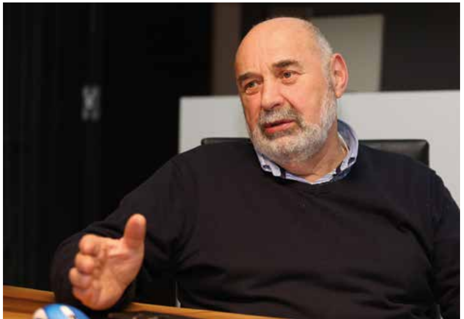
Z zadovoljstvom zre na prehojeno pot in s ponosom na sinova, ki jo nadaljujeta.

22 let sem bil star. Ko sem odslužil vojsko, sem se družil s študenti in eden me je vprašal, če bi šel, ker Slovenijales v Združenih državah rabi mizarje za montažo pohištva. Priporočil me je prijatelju, ki je delal na oddelku Slovenijalesa za izvoz v Severno Ameriko. Lažje sem se odločil, ko mi je povedal, da se na odhod pripravljata še dva mizarja iz cerkniškega Bresta. Ker je bil Brest takrat še samostojen, so me prezaposlili in v ZDA sem odšel preko Slovenijalesa, ki je bil tam lastnik treh montažnic. Ena je bila v New Jerseyju, druga v Atlanti v Georgi in tretja v Houstonu v Teksasu. Določen sem bil za Atlanto. Ker sem želel biti s prijateljema, sem prosil, da grem z njima v New Jersey, in ugodili so mi.