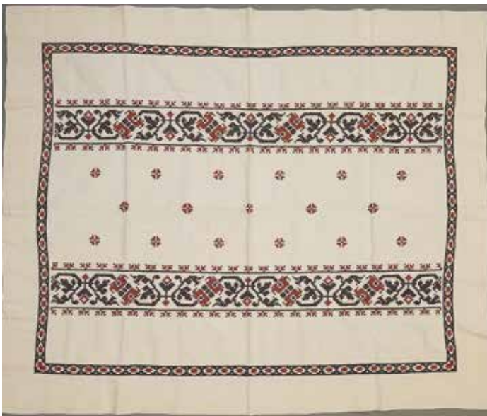
Prt z merami 132 x 160 cm je narejen iz domačega platna.