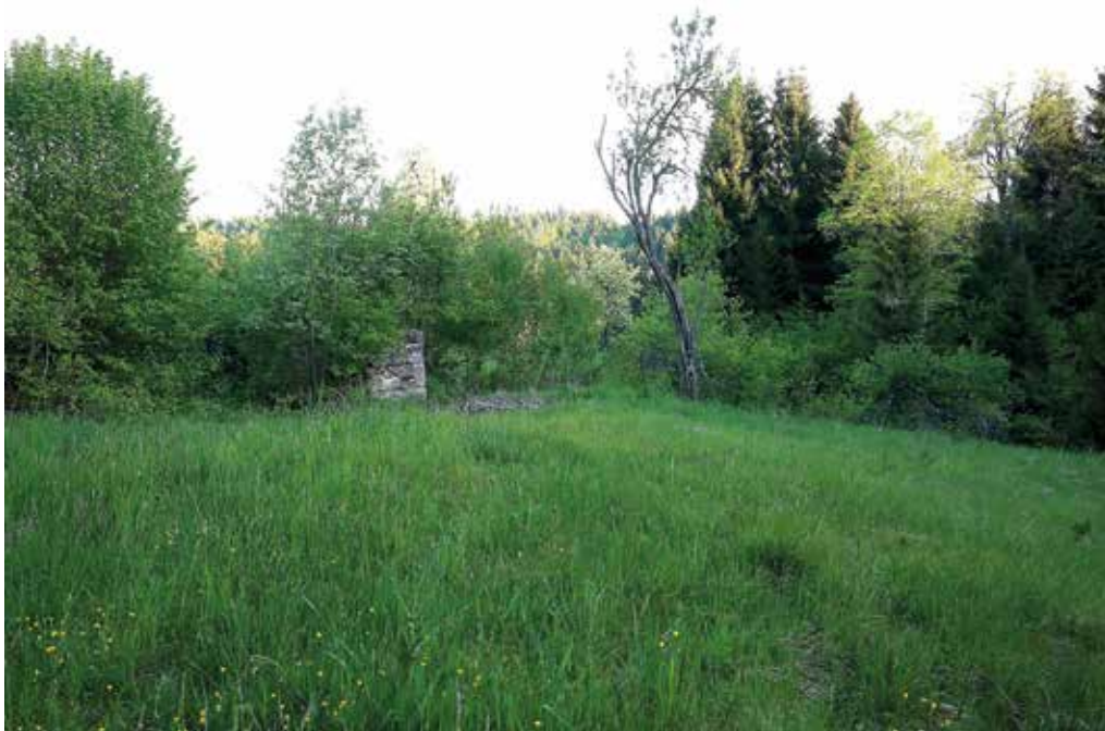
Zaraščanju Ščurkovo ni ubežalo.

»V tihem mraku pa milo poje ščurk ...« so leta 1873 zapisali v Kmetijskih in rokodelskih novicah . Pred davnimi leti so morda v tamkajšnji tihoti poslušali petje čričkov, moralo jih je biti vse polno, in poimenovali vas. Kljub današnjemu prizvoku je možno, da je to najbolj poetična označba kraja v občini.