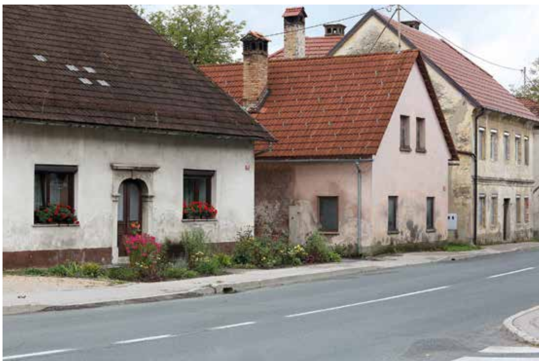
Obnova starih hiš lahko investitorjem in projektantom predstavlja velik izziv.

pripravi, so uravnoteženi in vedno v skladu z veljavno zakonodajo,« je jasna, »je pa prostorski akt dokument, ki nemalokrat povzroči tudi nejevoljo.« Različni deležniki imajo različne interese, naloga strokovnih služb pa je, da vedno zasledujejo javni interes. »Prostorski načrti vedno sledijo vrednotam v prostoru in kar je nujno potrebno, je, da vsi mi, ki živimo v določenem okolju, te vrednote prepoznamo kot prednost in ponotranjimo dejstvo, kako pomembni so naravna in kulturna dediščina in ohranjanje te za določeno območje,« zaključuje.