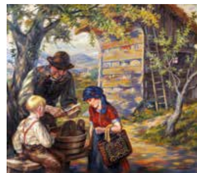
© Maksim Gaspari: Dekle ob čebelnjaku

Izbrani okvirji so stari, nekateri tudi 100 let in več. Reprodukcije dobijo poseben značaj prav v primernih okvirjih, nekateri so čim podobnejši okvirju originalnega dela, drugi ne. Vsak okvir je očiščen, zaščiten proti insektom in strokovno pregledan. Risba oz. mešana tehnika je običajno pod steklom, ki je lahko navadno, antirefleksno ali galerijsko. Za izdelavo reprodukcij imam pridobljene avtorske pravice s strani Gasparijevih dedičev. ■