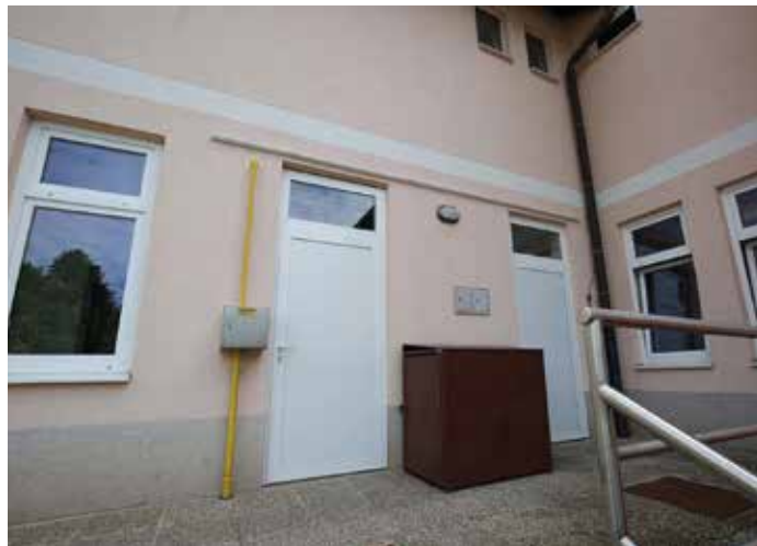
Nova zunanja vrata na Podružnični osnovni šoli 11. maj Grahovo

Lokalna skupnost se velikokrat sploh ne zaveda, da urejeno in udobno okolje kot ustanoviteljica šol in lastnica objektov zagotavlja ravno Občina Cerknica, ki v dogovoru z vodstvi šol glede na potrebe načrtuje ključna vlaganja. Trud lokalne skupnosti je prepoznal tudi tuji donator, ki je poleg donacije za obnovo mladinskega centra sredstva namenil tudi ureditvi senzorične sobe v cerkniški šoli, ki je že v urejanju.