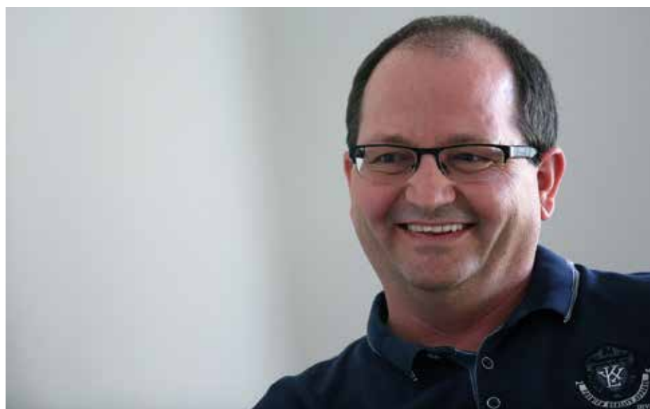
Projekti zahtevajo nova znanja, tudi tujih jezikov. Na prvem mestu je angleščina, domači so mu tudi nemščina, francoščina, italijanščina in hrvaščina.

Z mobilnostjo v metropolitanskih mestih oziroma regijah. V posameznih vozliščih ob evropskih prometnih koridorjih bomo skušali zgostiti prebivalstvo in tam ustvarjati območja z visoko kakovostjo življenja; klimatsko nevtralna, z učinkovito preskrbo z javnimi storitvami, prometom, mobilnostjo, z inovativnimi oblikami prometa. Razvijamo tri segmente, kako upravljamo s temi območji, kakšne tehnološke inovacije lahko uvajamo, v Rigi, Milanu, Barceloni, Portu imamo fenomenalne rešitve, in kakšne finančne mehanizme lahko oblikujemo, da razbremenimo proračun. Pri dodatnih