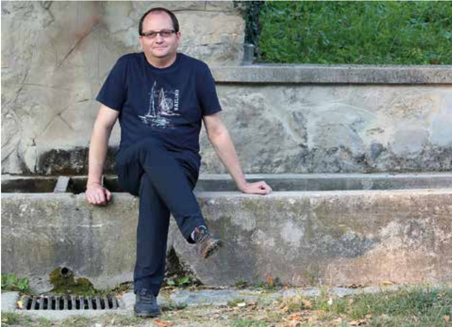
Del letošnjega leta bi moral preživeti v Parizu, a mu je zagodel novi koronavirus.

finančnih virih izhajamo iz tega, da tisti, ki onesnažuje, onesnaževanje plača, dobljena sredstva pa bi šla v okolju prijazna prevozna sredstva.