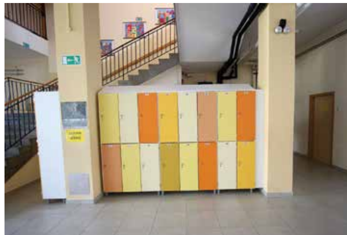
Garderobne omarice na cerkniški šoli

Soočasno z zunanjo prenovo pa potekajo naložbe v notranje prostore in njihovo opremo v šolah v Cerknici, Begunjah, Grahovem, na Rakeku in Uncu. Treba je poudariti, da Občina Cerknica na letni ravni za naložbena vlaganja v šolske prostore namenja približno 100.000 evrov naložbenih sredstev – obnova učilnic, specialnih učilnic, sanitarij, skupnih prostorov, nakup in montaža pohištva, računalniške opreme, senčil. Občina je zagotovila sredstva za nakup garderobnih omaric, ki so postavljene na hodnikih, pred učilnicami cerkniške šole. Se pa lahko šola zato veseli nove namembnosti prejšnjih garderob. Občina Cerknica je skupaj z donatorjem poskrbela za prenovo prostora, Zavod Samostojen si in partnerji projekta Lokalne akcijske skupine Notranjska pa za njegovo opremo. Cerkniška osnovna šola se lahko pohvali tudi z letos obnovljeno avlo. Novi pa sta tudi razdelilna kuhinja in jedilnica.