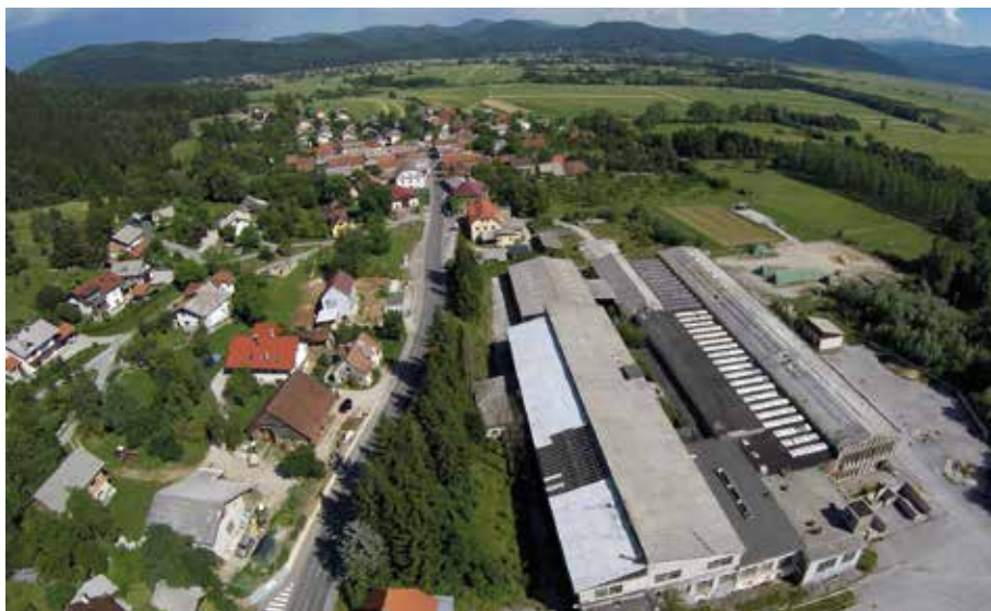
Se leta 1987 je imela tovarna 278 zaposlenih.