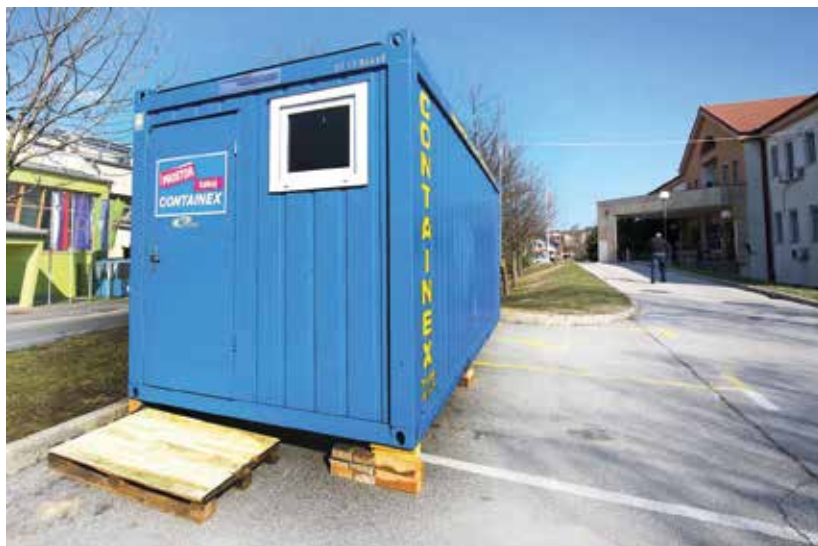
Pacienti z akutno okužbo dihal z ali brez vročine so po presoji zdravnika pregledani v zaboju.

Zavedamo se izzivov, s katerimi se v letošnjem šolskem letu soočamo vsi, tako starši, otroci kot tudi mi zdravniki. Z novim šolskim letom se zaradi ugodnejših vremenskih vplivov in druženja v zaprtih prostorih vsako leto poveča tudi število okužb z respiratornimi virusi. Pojavijo se prehladna obolenja, ki jih spremljajo izcedek iz nosu, kihanje, bolečine pri požiranju, hripavost in blago povišana telesna temperatura. Šole in vrtci, kjer je na enem mestu zbranih veliko otrok, za širjenje teh virusov nudijo idealne pogoje. Otroci z okužbo dihal so najbolj kužni v prvih dneh, ko se pojavijo omenjeni bolezenski znaki, zato je pomembno, da takrat ostanejo doma in ne širijo okužbe na druge otroke. Zavedati se moramo, da lahko tudi običajni sezonski virusi pri občutljivih in najmlajših otrocih povzročijo okužbo spodnjih dihal (bronhitis in bronhitis), ki lahko zahteva tudi bolnišnično zdravljenje.