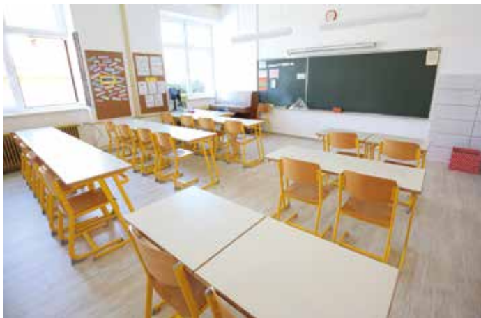
Obnovljena učilnica na Podružnični osnovni šoli Maksima Gasparija Begunje

Občina je leta 2014 s pomočjo lastnih sredstev in takratnega Ministrstva za infrastrukturo in prostor financirala obnovo celotnega fasadnega ovoja stavbe, izolacijo podstrešja in strehe, zamenjavo stavbnega pohištva, optimizacijo ogrevalnega in kurilnega sistema ter obnovo kleparskih izdelkov. Naložba je bila skupno vredna nekaj več kot 1,1 milijona evrov, 866.000 evrov pa je Občina Cerknica dobila iz javnega razpisa za sofinanciranje operacij za energetske sanacije stavb v lasti lokalnih skupnosti. Leta 2014 je Občina Cerknica prav tako poskrbela za energetske sanacije Podružnične šole Maksima Gasparija v Begunjah. Sredstva v višini dobrih 98.000 evrov za zamenjavo oken in vrat ter toplotno izolacijo fasade in stropa proti neogrevanemu podstrešju je v 85 odstotkih pridobila iz Kohezijskega sklada, preostali delež pa iz občinskega proračuna.