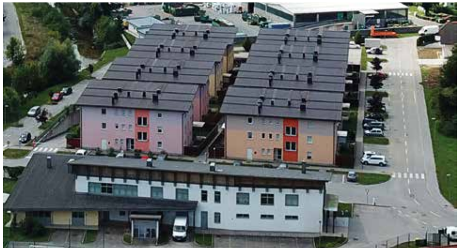
Občina Cerklja ob Dravi prostorske načrte obravnava vsaki dve leti.

V fazi javne razgrnitve lahko širša javnost vpliva na osnutek pripravljene akta, občina pa mora vse podane pripombe skupaj s strokovnimi sodelavci tudi oceniti in se do njih