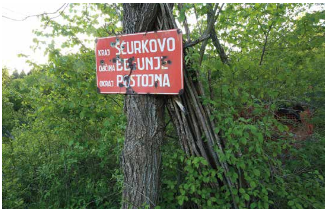
Leta 1952 je bil sprejet zakon, ki je Slovenijo razdelil na kraje, okraje in občine.

Na Ščurkovo se je ponovno naselila tihota, ruševine hiš se počasi izgubljajo med grmičevjem in drevjem, le črički še vedno pojejo pred vhodom v svoje domke.