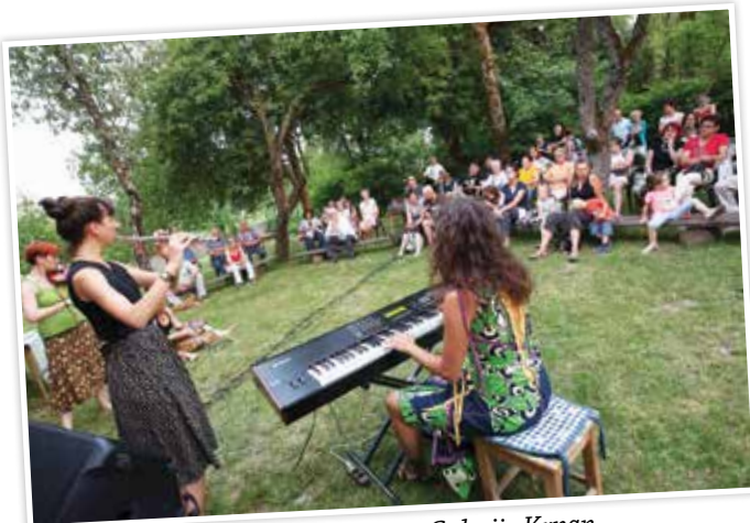
Koncert zasedbe Djembabe na vrtu Galerije Krpan.