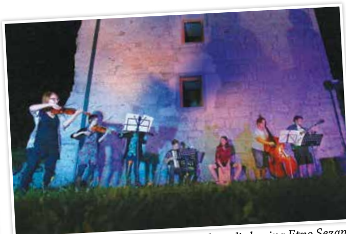
Znotraj taborskega obzidja je nastopila tudi skupina Etno Sezam.