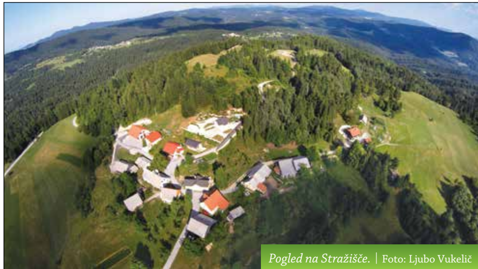
Pogled na Stražišče.

Pri pregledu rodovnika Intiharjevih , njihove hiše ni več, ugotovimo, da so se v 150-ih letih, kolikor jih lahko spremljamo iz župnijskih knjig (1824–1961), v njihovem rodu povezale trojiške in vidovske vasi: Sveta