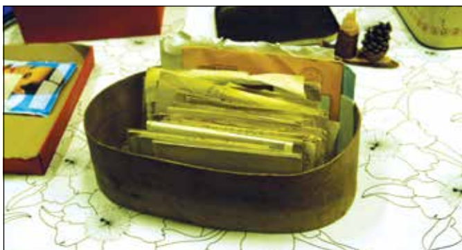
Arhiv družine Bizjak.