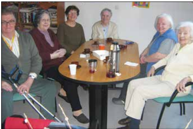
V Domu starejših občanov v Cerknici delujeta dve skupini starih ljudi za samopomoč, na fotografiji člani skupine Sončnica.

Medgeneracijsko društvo Zimzelen Cerknica združuje prostovoljce-voditelje skupin starih ljudi za samopomoč in člane teh skupin. Skupine so ustanovljene z namenom premagovati osamljenost, življenjsko in duhovno praznino ter dajati smisel tretjemu življenjskemu obdobju, srednji generaciji pa omogočiti pripravo na lastno starost.