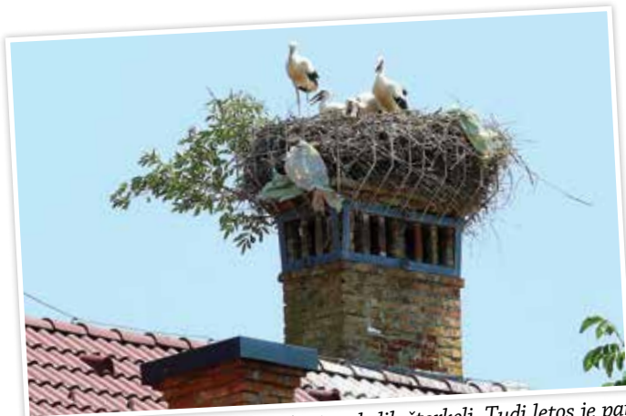
Martinjak je že več let dom družine belih štokelj. Tudi letos je par poskrbel za naraščaj.