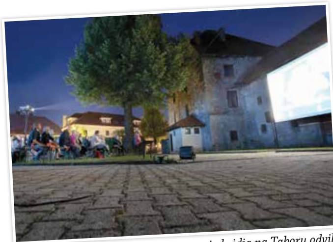
Konec avgusta se je na prostem znotraj obzidja na Taboru odvila projekcija dokumentarnih filmov, ki so jo s kulinarčno ponudbo popestrila lokalna društva.