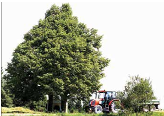
Lipi in kapelica.

Stražiščarji pa so se kljub trdemu delu in pomanjkanju znali tudi zahvaliti; pod vasjo je na križišču poleg dveh lip postavljena kapelica kot znamenje hvaležnosti