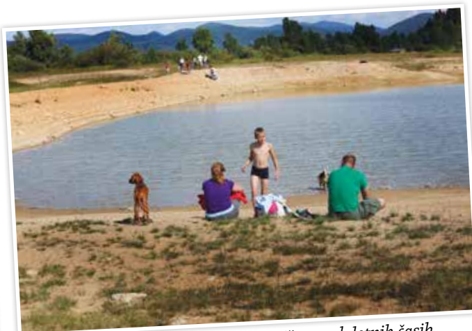
Cerkniško jezero – priljubljeno zatočišče v vseh letnih časih.